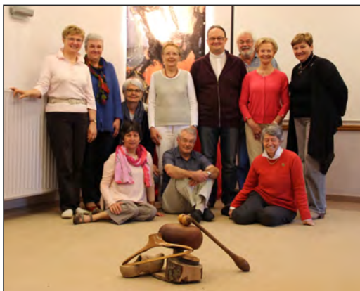
Retraite UP Theux à Mehagne (voir page 24)