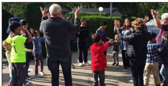
Cours de français aux réfugiés