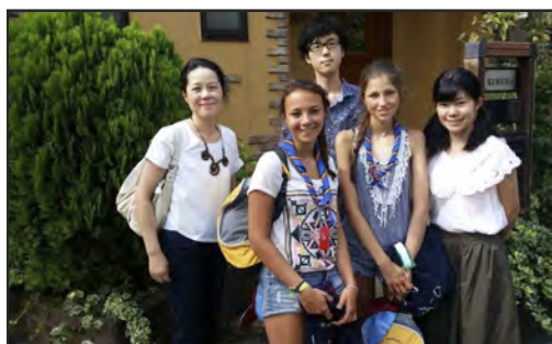
Jamboree 2015 au Japon (voir page 10)