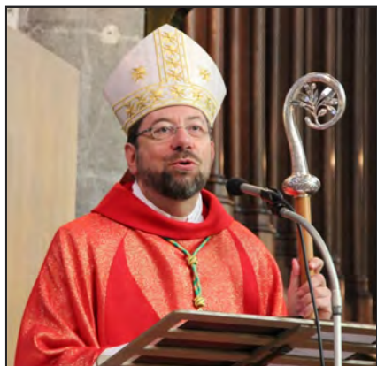
Monseigneur Delville (voir page 17)