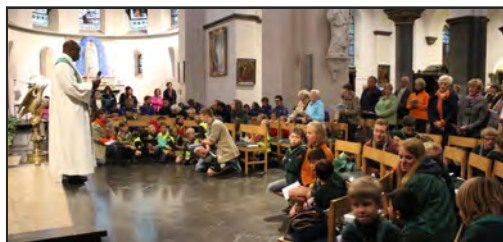
Rentrée pastorale à Spa (voir page 22)