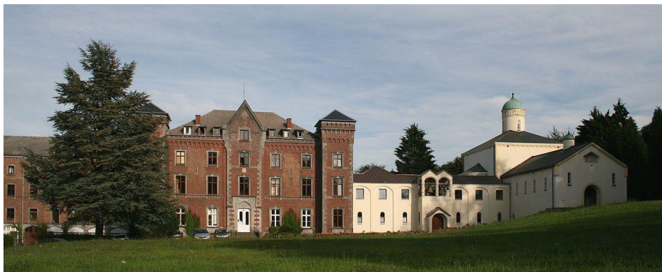
Abbaye (depuis 1990) de Chevetogne avec l'église byzantine à droite. Vue actuelle.

Depuis Tancrémont et Chevetogne, les moines sensibilisent à la liturgie orientale. Ainsi, à Theux, des moines de Chevetogne sont venus célébrer à l'église dans le rite byzantin. « Le lundi 9 janvier 1956, le Père Athanase, bénédictin pour l'Union des Églises, donnera une conférence, avec projections, sur la vie des moines du Mont-Athos. Dans le cadre de la semaine de prières pour l'Union des Églises, mercredi 25 janvier, le soir, à 19h30, liturgie byzantine par les moines bénédictins de Chevetogne : on pourra communier sous les deux espèces. Les chants très particuliers de cette messe de rite slavon seront exécutés par les jeunes filles de la JICF paroissiale. » (Archives de la Cure de Theux, Cahier des annonces 1955-1956 ). En 1957, les Bénédictins cèdent Tancrémont aux Prémontrés.