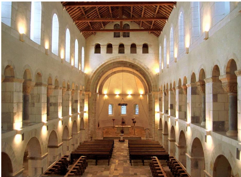
Église abbatiale de Rochefort.